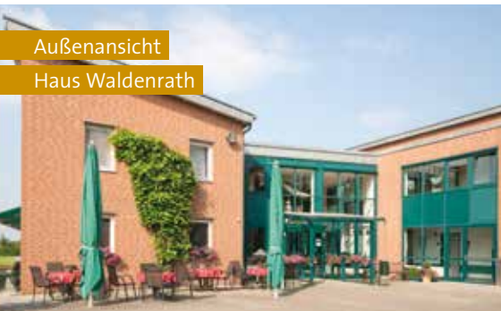
Außenansicht Haus Waldenrath