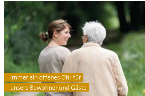
Immer ein offenes Ohr für unsere Bewohner und Gäste