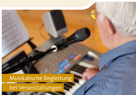
Musikalische Begleitung bei Veranstaltungen