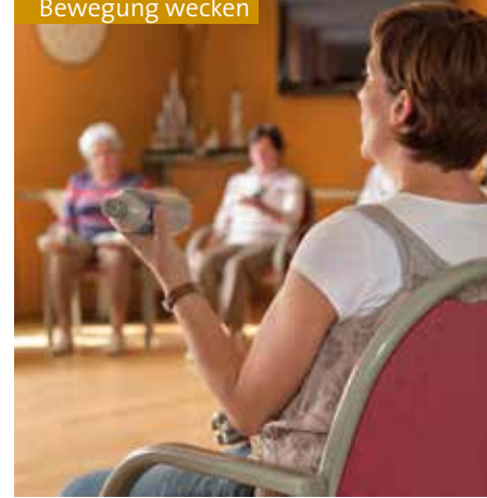
Spaß an Bewegung wecken