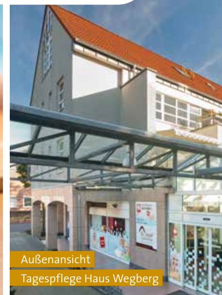
Außenansicht Tagespflege Haus Wegberg