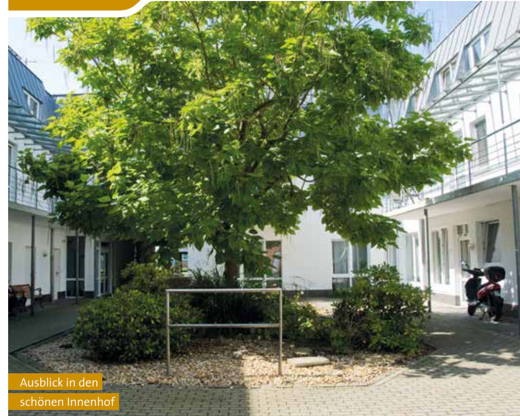
Ausblick in den schönen Innenhof