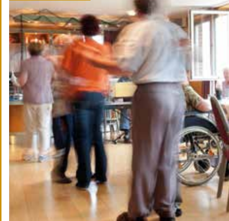
Ausgelassene Stimmung beim Tanzen