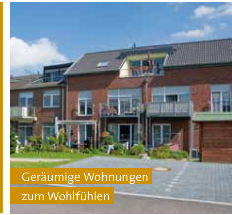
Geräumige Wohnungen zum Wohlfühlen