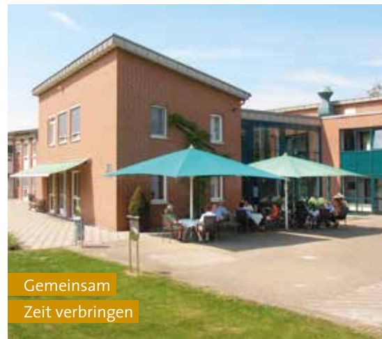
Gemeinsam Zeit verbringen