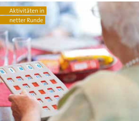
Aktivitäten in netter Runde

Jedes unserer Häuser ist zeitgemäß eingerichtet, liebevoll gestaltet und besitzt einen besonderen Charme. Detailreiche Dekorationen kreieren eine gemütliche Atmosphäre. Für unsere Pflegebedürftigen und ihre Angehörigen nehmen wir uns immer viel Zeit – denn Verstehen beginnt mit dem Zuhören.