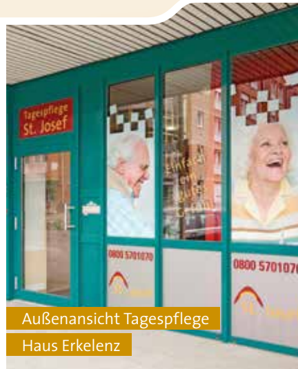
Außenansicht Tagespflege Haus Erkelenz

Bei gemeinschaftlichem Singen, Tanzen und Basteln erleben unsere Tagesgäste gesellige Stunden unter Gleichgesinnten. Traumreisen und Meditationen laden zum Entspannen und Ausruhen ein.