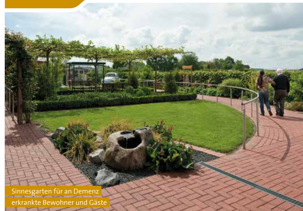
Sinnesgarten für an Demenz erkrankte Bewohner und Gäste