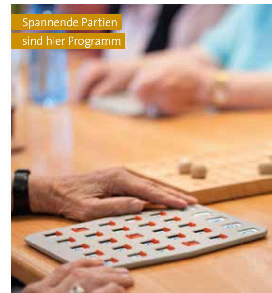
Spannende Partien sind hier Programm