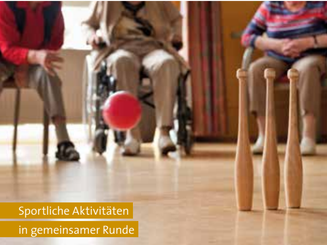
Sportliche Aktivitäten in gemeinsamer Runde