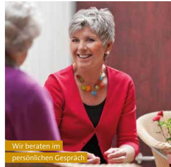
Wir beraten im persönlichen Gespräch

Vertrauen Sie auf unsere Erfahrung: Wir beantworten Fragen, informieren und unterstützen bei der Beantragung unterschiedlicher Leistungen. Gemeinsam finden wir heraus, welche Form der Pflege – Heimpflege, Tagespflege oder die Kombination aus Heim- und Tagespflege – für Sie oder Ihren Verwandten passend ist. Verlassen Sie sich auf unsere Pflegeexpertise.