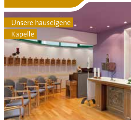
Unsere hauseigene Kapelle

„Nette Gesellschaft und eine natürliche Umgebung – bei St. Josef fühle auch ich mich immer wohl.“