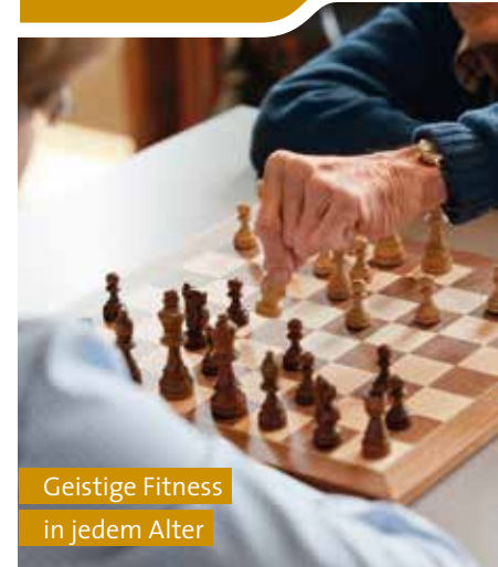
in jedem Alter