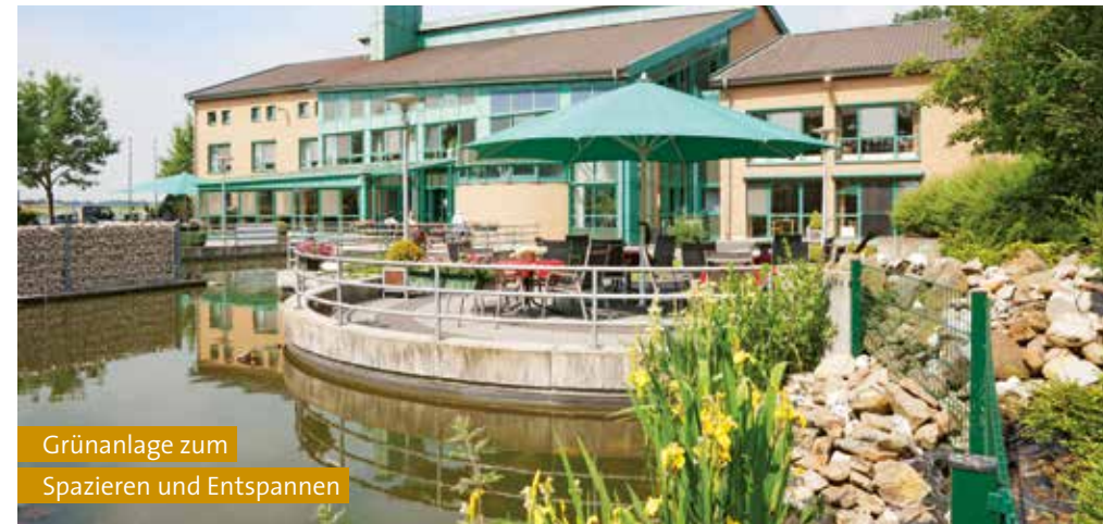
Grünanlage zum Spazieren und Entspannen