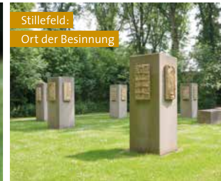
Stillefeld: Ort der Besinnung