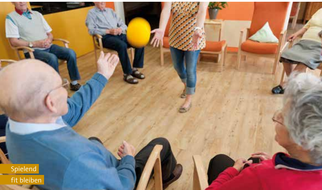
Spielend fit bleiben

Exklusiv in der Region sind wir sieben Tage die Woche für unsere Gäste da. Das schließt selbstverständlich auch Feiertage mit ein. Unser kompetentes und liebevolles Pflegepersonal nimmt sich viel Zeit für die Bedürfnisse unserer Gäste und leistet professionelle und individuelle Hilfestellungen. Wir unterstützen auch gern bei Anträgen zur Kostenübernahme und weiteren administrativen Fragen – sprechen Sie uns an!