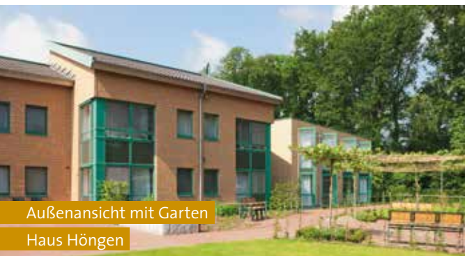
Außenansicht mit Garten Haus Höngen